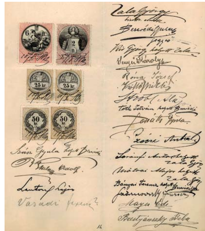
9. Szobrászok – köztük Zala György, Senyei Károly és Róna József – aláírásai a versenytárgyalás kiírása ellen tiltakozó levélen

Steindl javaslata nem sokkal később elkészült, a homlokzatokra 96, az épület belsejébe pedig 98 szobrot szánt. Kint a magyar fejedelmeket, királyokat és hadvezéreket, bent pedig a „parlamentaris élet kitünőségeit” gondolta ábrázolni, azonban kérte, hogy javaslatát ne tekintse véglegesnek, nehogy óriási költségeket vállaljon magára az építkezés.