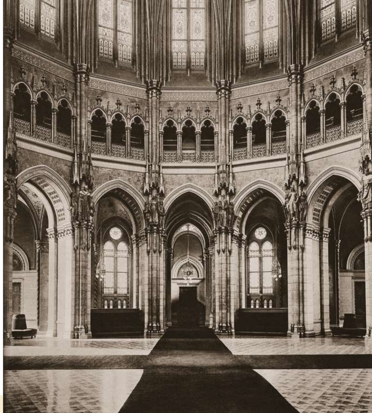
11. Királyszobrok a kupola-csarnokban, 1906