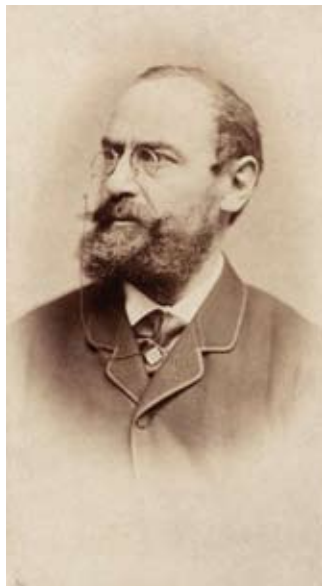
8. Tisza Lajos, a Végrehajtó Bizottság elnöke

A kérdést azonban érdemben nem tárgyalták, hiába írták a szobrászok, hogy legalább öt évre van szükségük egy ekkora munka esetén. Két évvel később próbálkoztak újra, az 1889. januári levél nyomán azonban csak bő egy év elteltével kezdődött meg a részletes szobrászati program kidolgozása. Steindl vonakodott dönteni, arra hivatkozva, hogy nem csak az ő felelőssége, hogy kit vagy mit ábrázoljanak a szobrok. Az Osztrák–Magyar Monarchián belüli Magyar Királyság törvényhozási épületének szobrászati programja valóban kényes ügy volt, elsősorban politikai és nem építészeti kérdés. Egy gyakorlatiasabb kifogása is volt Steindlnek, mégpedig hogy az elkészülő alkotások raktározása is gondokat okozna. Ismét eltelt egy év, mikor 1891 elején már Steindlt is aggaszthatta a szobrászmunka időigénye, ezért előterjesztést intézett a bizottsághoz, hogy tárgyalásokba bocsátkozhasson a kérvényt benyújtó szobrászokkal. Ekkorra az alapozás és a falak emelése már jelentősen előrehaladt. 1890–1891 telén a munkálatok mindenhol elérték az első emelet alatti padló szintjét.