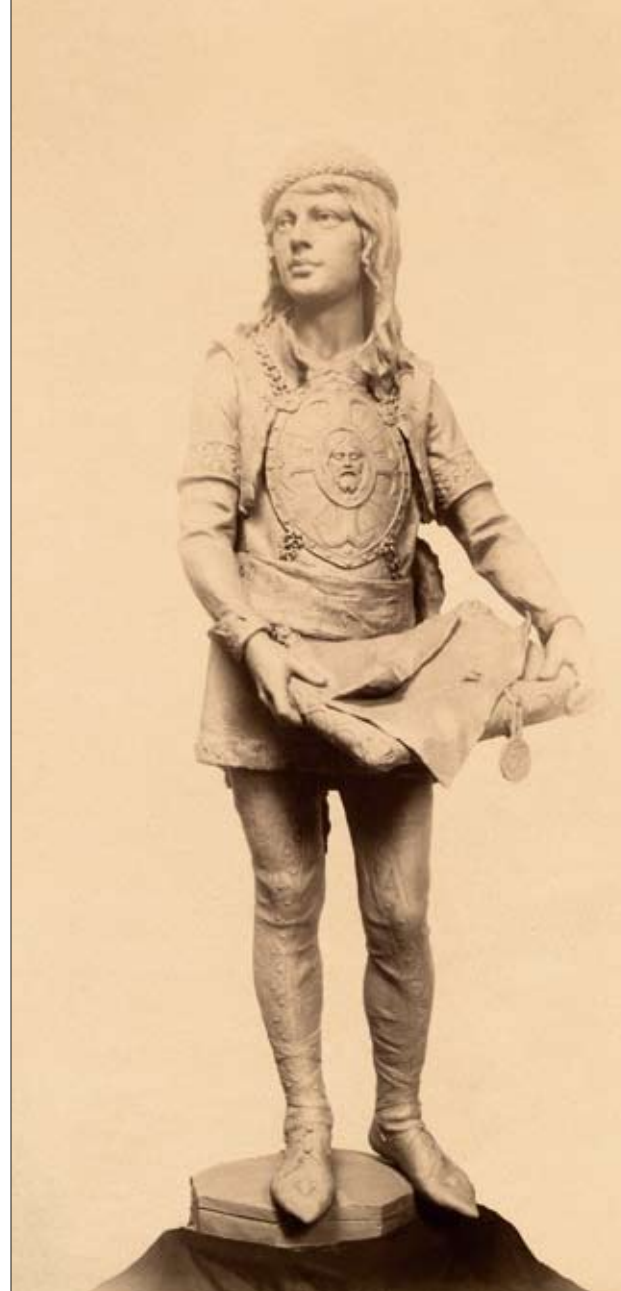
10. Apródszobor gipszmintája

Egy kő- vagy fémszobor a kezdeti elképzeléstől a megvalósulásig több fázison átesve jut el. Első lépés a szobrot bemutató, annak végleges méretétől függően fél, harmad vagy még kisebb nagyságú agyag- vagy gipszminta elkészítése. Ezt általában a megbízó vagy a lebonyolítással megbízott bizottság bírálta el, és ennek ajánlái, kérései nyomán a szobrász vagy átdolgozta, vagy elfogadás esetén hozzálátott a teljes méretű minta megvalósításához. Amikor ez elkészült, újra a megbízó vagy bizottsága elé került a szobor. Ha a megrendelő már mindennel elégedett volt, akkor kőszobor esetén egy gipszmintáról megkezdődhet a kőbe nagyolás vagy az átponozás folyamata, bronznál vagy más fémnél pedig az öntéshez szükséges negatívok előkészítése. A művészek a szobrok kivitelezését néha vállalkozókra bízták, különösen akkor, ha drága fémöntési munkákra volt szükség. A faragás vagy az öntés eredményét a megbízó vagy a bizottság ismét megsejtelte, ám ekkor már nagy mozgástér nem maradt. Éppen ezért is volt fontos az előbbieken leírt többlépcsős folyamat.